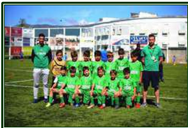
ACRCO O CRASTO – 1.º CLASSIFICADO – SUB-