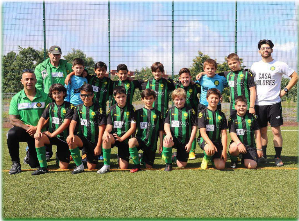
BENJAMINS – SUB 11 2020/2021