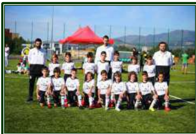
SL BENFICA – 1.º CLASSIFICADO – SUB-9