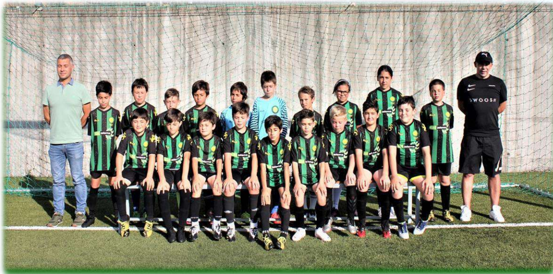
BENJAMINS – SUB 10 2020/2021