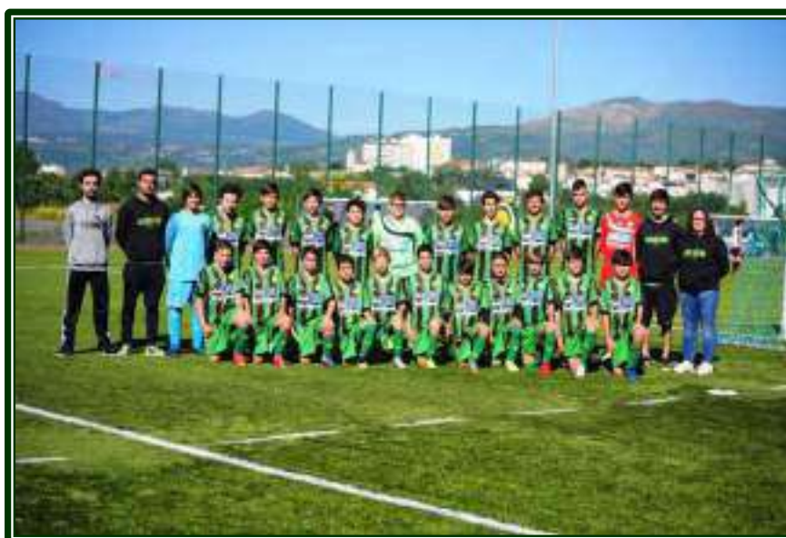
ABAMBRES SC – 1.º CLASSIFICADO – SUB-13