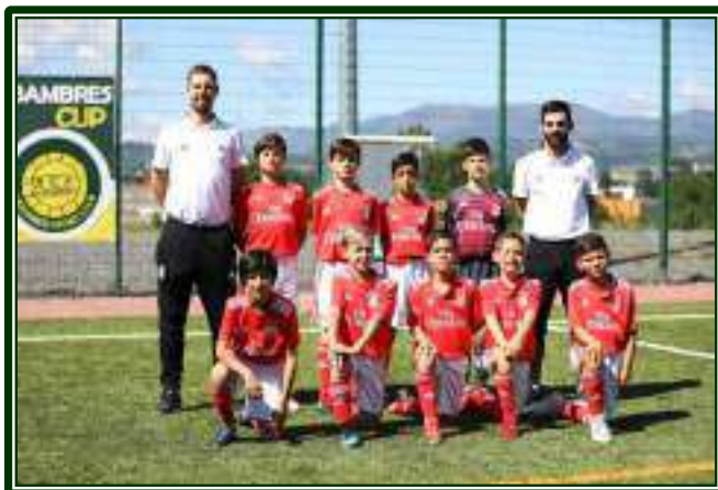
SL BENFICA – 1.º CLASSIFICADO – SUB-11